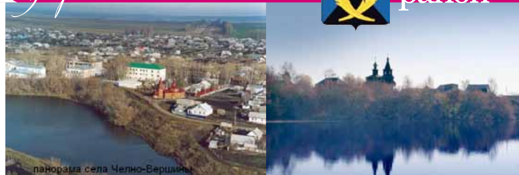
панорама села Челно-Вершины

Валовой сбор зерна в текущем году составил 31 тысячу тонн - это 68,1% к уровню прошлого года, средняя урожайность зерновых и зернобобовых культур - 15,8 ц/га (в 2014 году - 18,7 ц/га) при средней урожайности по области 15 ц/га.