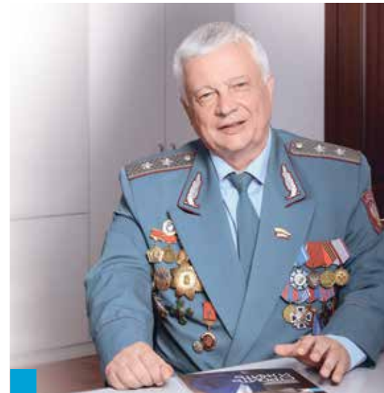
Александр Бахмуров, председатель Общественного Совета при УФНС Самарской области, государственный советник налоговой службы Российской Федерации III ранга, отличник ФНС России

От всей души желаем Вам энергии и оптимизма! Успехов в общественной и политической деятельности! Семейного благополучия! Крепкого здоровья!