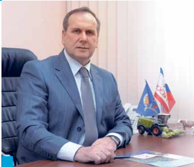
Николай Сомов, председатель комитета по сельскому хозяйству и продовольствию Самарской губернской думы