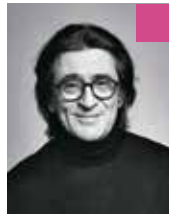
Юрий Башмет, народный артист СССР, альтист, дирижер, педагог:

– Детская музыкальная Академия СНГ – первая в своем роде. Такого нет больше нигде ни в нашей стране, ни в мире. Мы с вами пионеры.