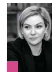
Ольга Любимова, министр культуры Российской Федерации:

«Дмитрий Шостакович создавал сложные и насыщенные произведения, которые вызывают искренний эмоциональный отклик у слушателей и своим уникальным стилем и подходом к композиции продолжают вдохновлять современных музыкантов.»